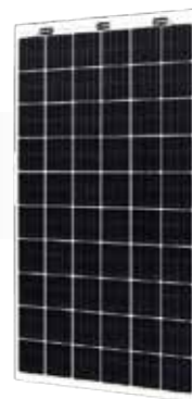
RAHMENLOSER PV-MODUL 12% TRANSPARENZ